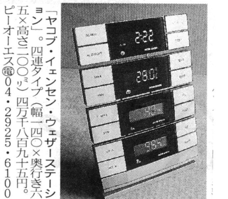
「ヤコブ・イェンセン・ウェザーステーション」。四連タイプ(幅一四〇×奥行三六五×高さ二〇〇) 四万八千八百九十五円。ピーオーエス 04・2925・6100